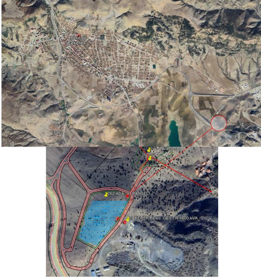
Resim 2.Çekerek Belediyesi Güneş Enerji Santrali Proje Sahası

Bölgede yapılan gözlemler dahilinde ortalama sıcaklık 9,2 °C olarak ölçülmüştür. Ortalama sıcaklıklara bakılacak olursa en sıcak ay Ağustos (26,5 °C) ve en soğuk ay Ocak (-5.3 °C) olarak gözlemlenmiştir. Yine aynı gözlem periyodunda maksimum sıcaklığın 38.8 °C olduğu ve minimum sıcaklığın -24.4 °C olduğu ifade edilebilir. Ayrıca yıllık ortalama güneşlenme süresi günde 6,7 saat olmak üzere yılda 2.445 saattir.